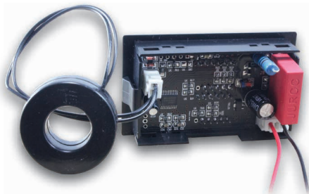
Рис. 1 – Задняя панель

Разъем Зрп для входного сигнала и питания